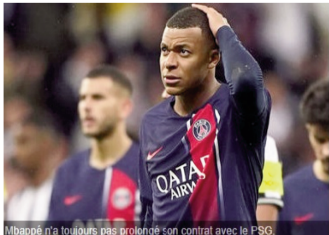
Mbappé n'a toujours pas prolongé son contrat avec le PSG.

En fin de contrat avec le Paris Saint-Germain, Kylian Mbappé devrait recevoir une offre contractuelle de la part du Real Madrid dès le 1er janvier 2024. Il aura deux semaines pour y répondre favorablement. Le cas échéant, la Maison Blanche se concentrera sur Erling Haaland.