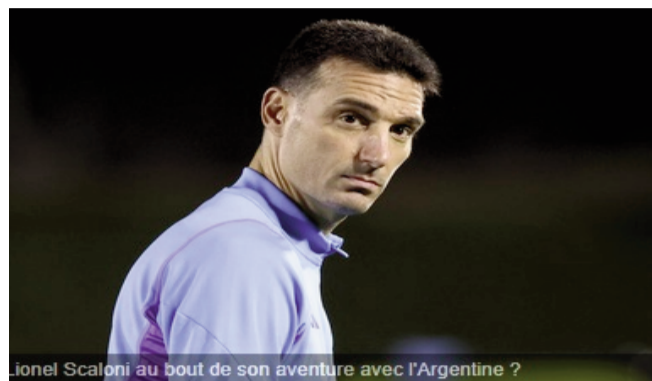
Lionel Scaloni au bout de son aventure avec l'Argentine ?

Intouchable depuis le sacre au Qatar, Lionel Scaloni a surpris tout son monde en jetant un flou sur son avenir. Une sortie qui a poussé le sélectionneur de l'Argentine, annoncé fâché avec Lionel